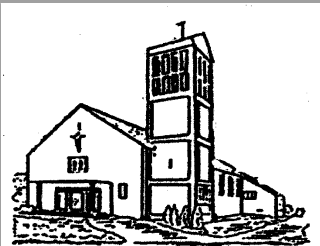
St. Theresia Schafbrücke Bismisheim