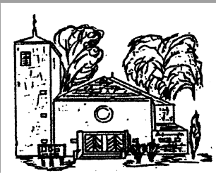
Hl. Familie Rentrisch